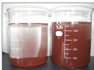
[分散・スケール防止]