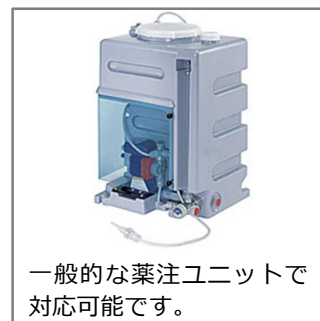
一般的な薬注ユニットで 対応可能です。