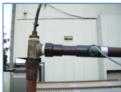
源泉井戸付近の配管へ